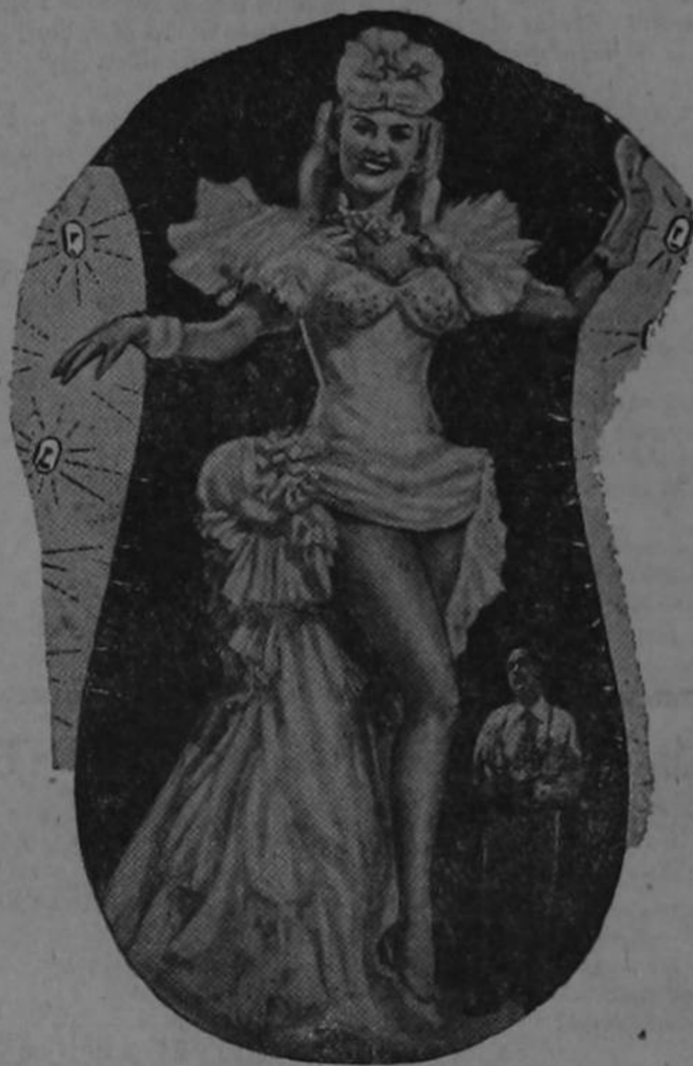
Mopy Cortés viene a bailar al "Sesteo" con don Ramiro Montero

Trabagargantas peor que este no se puede concebir. Y es común aún en escritores que se precian de ser académicos de la lengua, incurir en el fastidioso quequeo, propio más bien de un estilo municipal.