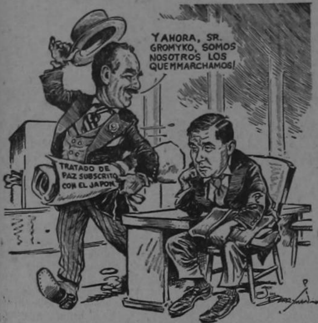
DE EL DIARIO "THE WASHINGTON STAR", WASHINGTON, E.U.A.

Esta caricatura apareció recientemente en "The Evening Star" un diario que se publica en la ciudad de Washington, Estados Unidos. Dean Acheson, Secretario de Estado y Presidente de la Conferencia para la Paz del Japón que se reunió recientemente en San Francisco de California, sale de la Conferencia con el Tratado de Paz suscrito con el Japón,